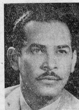
c. Representante BLAS ROCA Srio. General del Partido Socialista Popular de Cuba

Acabamos de recibir confirmación oficial, enviada por el c. Senador Juan Marinello, Presidente del Partido Socialista Popular, de que el 9 de Diciembre arribará a nuestro país, para permanecer algunos días en él, el gran dirigente comunista cubano, Secretario General del Partido Socialista Popular y miembro de la Cámara de Representantes, Blas Roca.