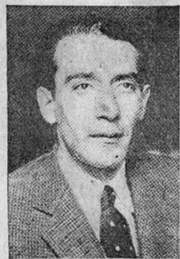
LIC. VICENTE LOMBARDO TOLEDANO

EN LA REUNION DEL CONSEJO DE LA "CTAL" ESTARAN REPRESENTADOS MEXICO, GUATEMALA, EL SALVADOR, NICARAGUA, PANAMA, COLOMBIA, VENEZUELA, PERU, ECUADOR, BOLIVIA, PARAGUAY, BRASIL, URUGUAY, ARGENTINA, CHILE, CUBA, SANT ODOMINGO, PUERTO RICO, HAITI